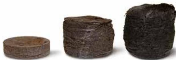
Jiffy-7 pellet in 3 stappen